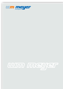
Hersteller-Logo als Farbdruck und Wasserzeichen