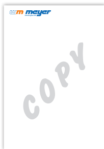
Automatischer Hinweis auf Kopien

Papierstärken 80 g, 100 g, 130 g und 160 g